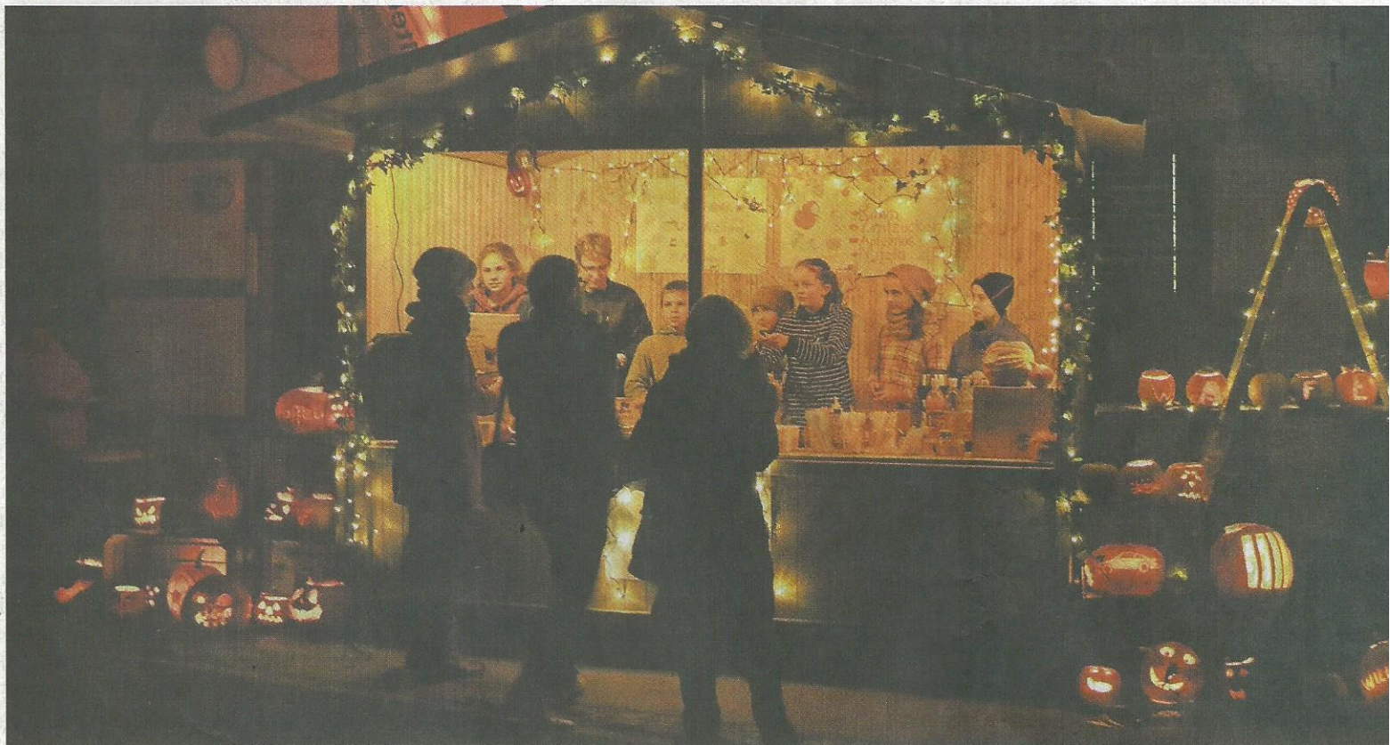
Waffeln gabs bei den Schülern – am Freitag waren viele Stände am Abend ausgeschossen.